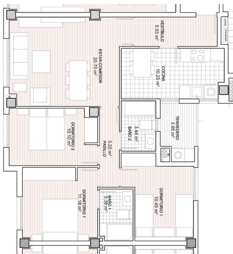
Planta de vivienda